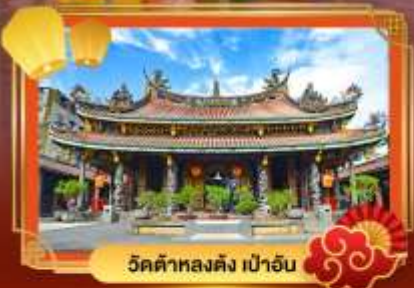
วัดต้าหลงตง เป่าอัน