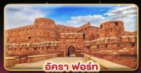
อัครา ฟอรั