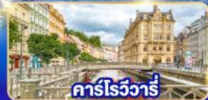
คาร์โรวัวร์