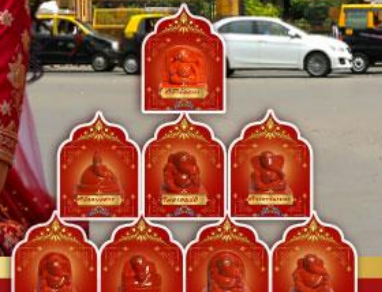
พระพิฆเนศ 8 องค์ เมืองปูणे