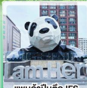
แพนด้าป็นตึก IFS