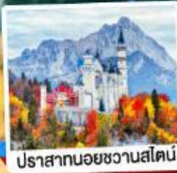
ปราสาทน้อยชวานสไตน์