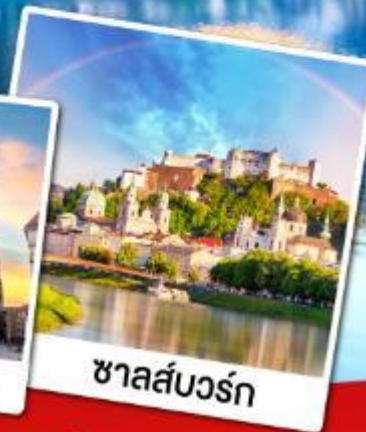
ชาลส์บวร์ก

เที่ยวหมู่บ้านฮิลสติกที่สวยงามที่สุดในโลก เข้าชมความงดงามภายในของปราสาทน้อยชวานสไตน์