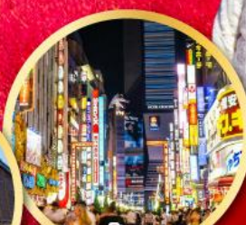
ช้อปปิ้ง ซินจุกุ