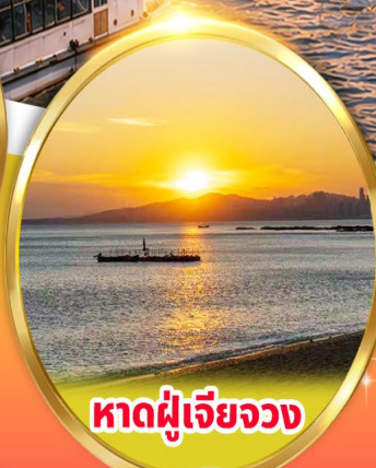
หาดผู้เจียวจง