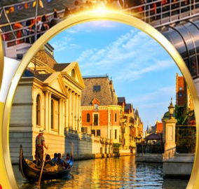
Venice Water City