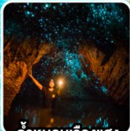
ถ้ำทอนเรืองแสง ไวโตโม