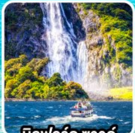
บิลฟอร์ด ซาวด์ นั่งเรือชมความงาม ฟยอร์ด