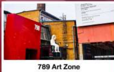
798 Art Zone