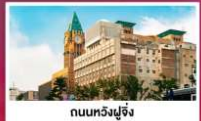
ถนนหวังฝูจิ่ง