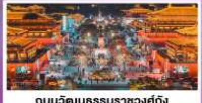
ถนนวัฒนธรรมราชวงศ์ถัง