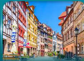
เที่ยวเมืองเก่าบูเรมเบิร์ก