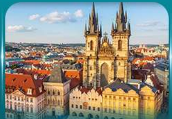
ชมปราสาทปราก ย่านเมืองเก่า