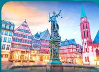
จัตุรัสโรเมอร์ แพรงก์เฟิร์ต