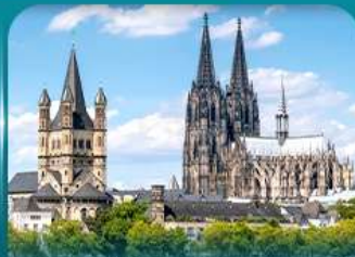
เซ็คจินมหาวิหารโคโลญ