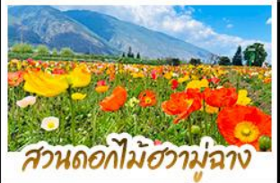
สวนดอกไม้ฮวามู่ฉาง