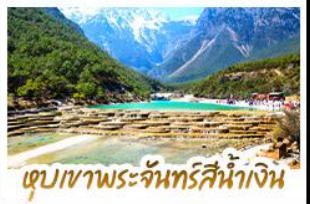
เขื่อนเขาพระจันทร์สีน้ำเงิน