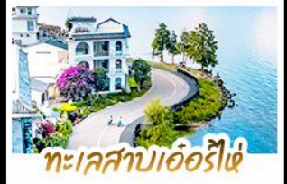
ทะเลสาบเอ๋อร์ไห่