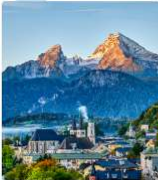
ออสเตรียบาวาเรียดินแดนแห่งเทพนิยาย