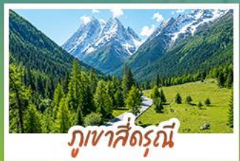
ภูเขาสี่ตรุนี