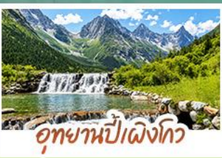
อุทยานปี่ฝิงโกว