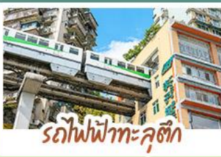
รถไฟฟ้าทะเลสาบสี่ถุนี

ชมธรรมชาติ ณ อู่หลง ชมหุบเขาสุดอลังการระดับมรดกโลก นั่งรถไฟฟ้าทะเลสาบสี่ถุนี สัมผัสกลิ่นเมืองดงซิงสุดล้ำ สัมผัสวิถีภูเขาหิมะแห่ง ภูเขาสี่ตรุนี งดงามจนได้รับฉายา "เทือกเขาแอลป์แห่งตะวันออก" ชมธรรมชาติสุดฟิน ณ อุทยานปี่ฝิงโกว • ซ้อมปิ้งจุกุ๊ ถนนคนเดินไท่ทู่หลี่, ถนนคนเดินซุนชี่ลู่