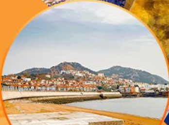
ซาจื่อโป่ว