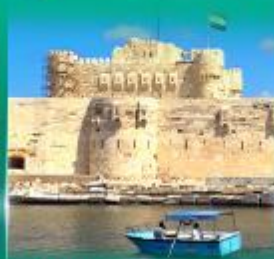
บึงนราการ Qulte Bay