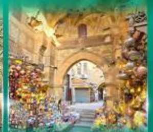
ตลาดผ่านเวลาอัลลี