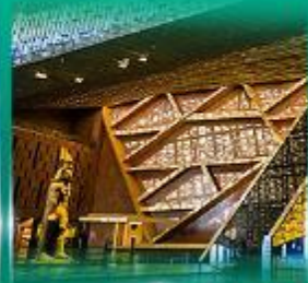
พิพิธภัณฑ์แกรนด์อียิปต์ (GEM)