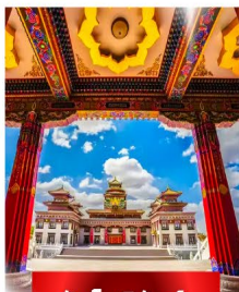
วัดโพธิ์สัตว์