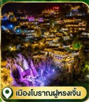
เมืองโบราณฝูหลงจีน