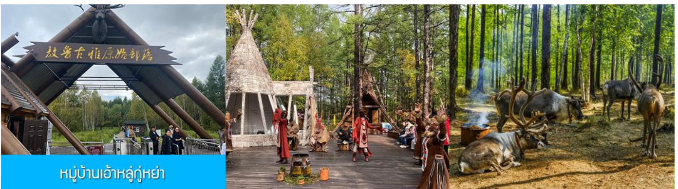
หมู่บ้านเอ้อเอ่อกู่่น่า