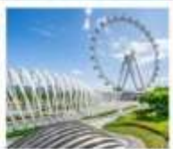
สวนสาธารณะ: OH BAY