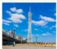
จัตุรัสอ่าวเจิ้ง