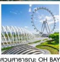
สวนสาธารณะ: OH BAY