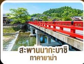
สะพานนากะบาชิ ทาคายาม่า