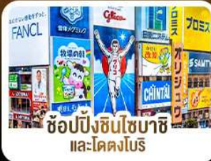
ช้อปปิ้งชินโซบาชิ และโดตงโบริ