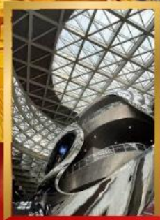
พิพิธภัณฑ์ศิลปะร่วมสมัยเซินเจิ้น

ชมสถาปัตยกรรมระดับโลก พิพิธภัณฑ์ศิลปะร่วมสมัยเซินเจิ้น (MOCAPE) และ Shenzhen Civic Center