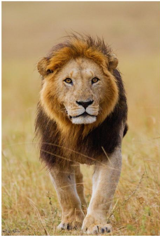
BIG FIVE GAME DRIVE

สัมผัสประสบการณ์สุดตื่นเต้น ชมสัตว์ป่าอย่างใกล้ชิดท่ามกลางธรรมชาติอันอุดมสมบูรณ์ ตื่นตาตื่นใจไปกับ "Big Five" อันเลื่องชื่อ ได้แก่ สิงโต ช้าง แรด ควายป่า และเสือดาว ที่ออกมาใช้ชีวิตอย่างอิสระในถิ่นอาศัยตามธรรมชาติ อีกหนึ่งไฮไลท์ที่ไม่ควรพลาด คือโอกาสในการชมปรากฏการณ์การอพยพของสัตว์ป่าขนาดใหญ่ ซึ่งชวนให้นึกถึงภาพอันยิ่งใหญ่คล้ายของ Maasai Mara National Reserve ที่มีชื่อเสียงระดับโลก