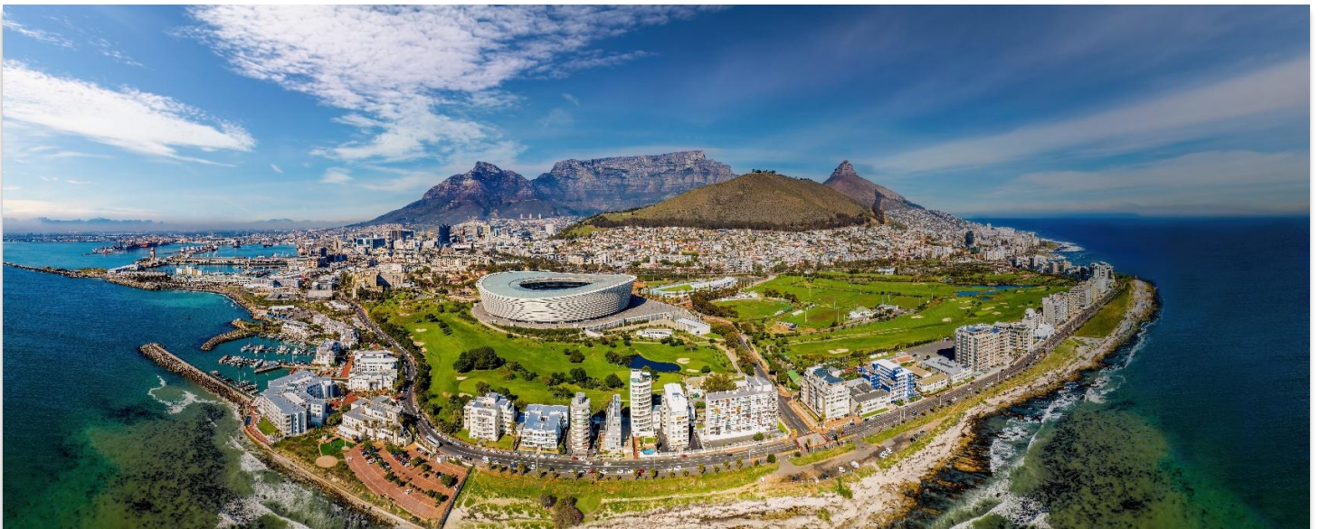
CAPE TOWN SOUTH AFRICA

01.00 น. ออกเดินทางสู่ กรุงไนโรบี ประเทศเคนยา เที่ยวบินที่ KQ887 06.05 น. เดินทางถึงท่าอากาศยานนานาชาติไนโรบี (แวะเปลี่ยนเครื่อง) 07.25 น. นำท่านออกเดินทางสู่ สนามบินนานาชาติเคปทาวน์ ประเทศแอฟริกาใต้ โดย สายการบิน Kenya Airways เที่ยวบินที่ KQ792 เดินทางเหนือระดับด้วยบริการระดับเวิลด์คลาสตลอดเส้นทาง 13.35 น. เดินทางถึง สนามบินนานาชาติเคปทาวน์ ประเทศแอฟริกาใต้ นำท่านผ่านขั้นตอนการตรวจคนเข้าเมืองและพิธีการทางศุลกากร และนำท่านขึ้นรถโค้ชเพื่อเดินทางสู่ เคปทาวน์ Cape Town เมืองท่องเที่ยวชื่อดังของ ประเทศแอฟริกาใต้ South Africa โดดเด่นด้วยทัศนียภาพอันงดงามของภูเขาและท้องทะเล ผสานกับวัฒนธรรมที่หลากหลายได้อย่างลงตัว ตั้งอยู่บริเวณปลายแหลมทางตอนใต้ของประเทศ จึงมีภูมิอากาศแบบเมืองตากอากาศที่สดชื่นตลอดปี นอกจากนี้ยังเป็นที่ตั้งของแหลมสำคัญที่มีชื่อเสียงระดับโลก อาทิ แหลมกู๊ด