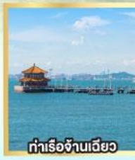
ท่าเรือจันทิว