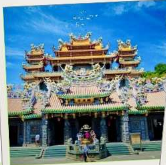
วัดกวนตุ๋