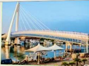
สะพานคู่รักตั้นสุ่ย