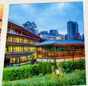
ห้องสมุดเป่ย์โถว