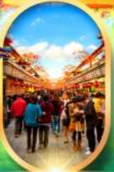
ถนนนากามิเสะ