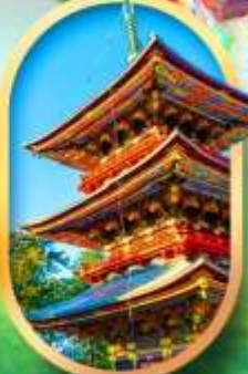
วัดนาริตะ-ซัง