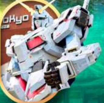
ห้างโอไดบะกินคัม