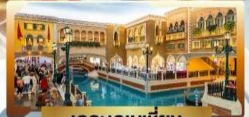
เดอะเวเนเชียน

4 วัน | 3 คืน | น้ำหนักกระเป๋า 23KG | พักโรงแรม 3 ดาว | บอนมาเก๊า 3 คืน