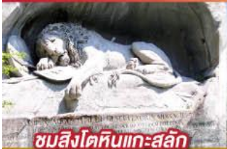
ชมสิงโตหินแกะสลัก