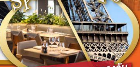
รับประทานอาหารกลางวันบนหอไอเฟล