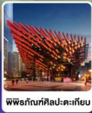
พิพิธภัณฑ์ศิลปะ-ตะเกียบ