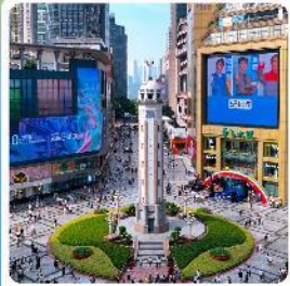
ถนนเจี่ยฟางเปี่ย