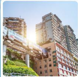
รถไฟทะเลสาบ