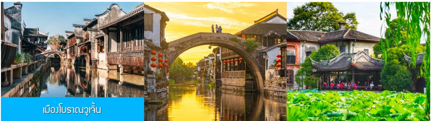
เมืองโบราณวูเจิน