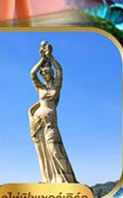
จูไห่ฟิชชอร์ทีร์รา