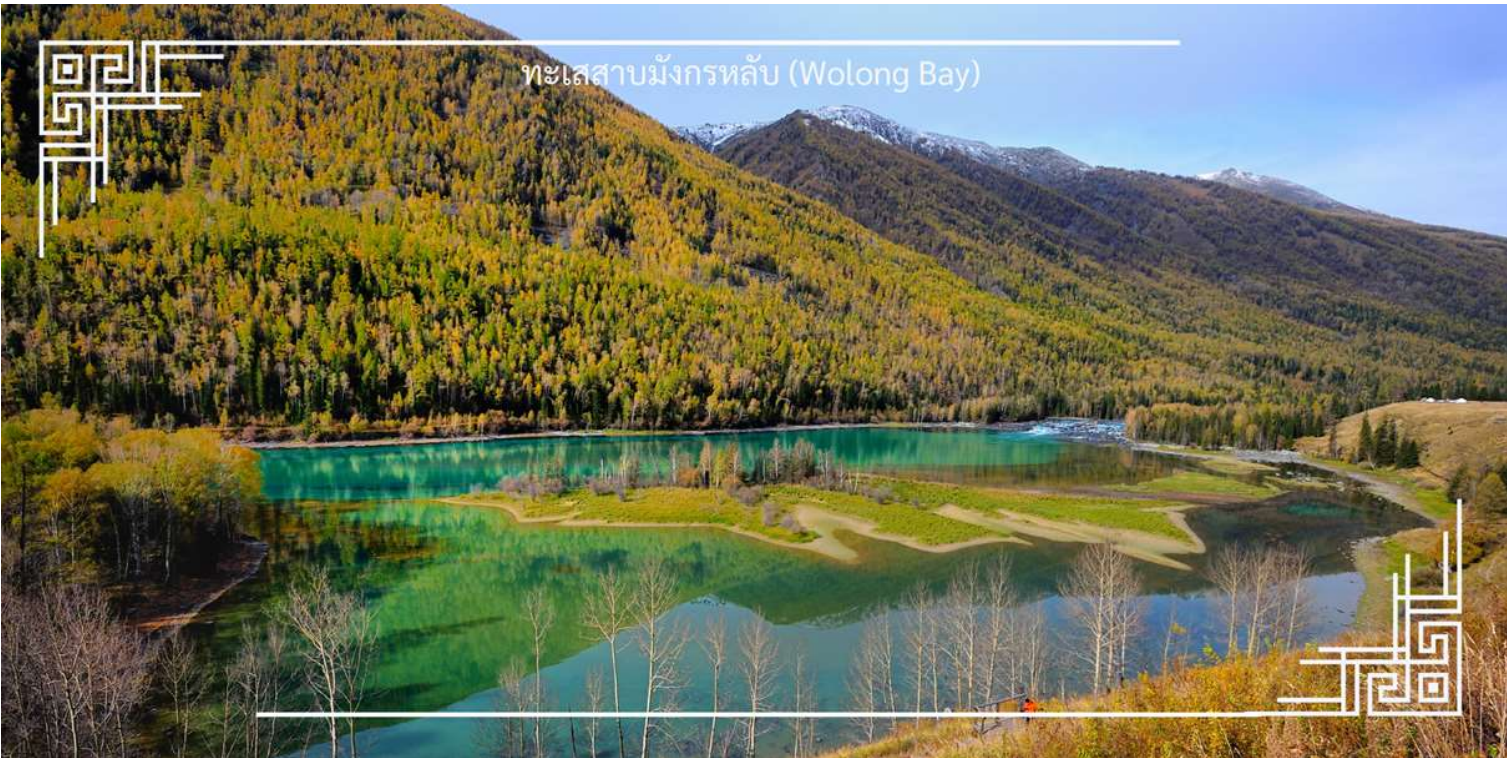
ทะเลสาบมังกรหลับ (Wolong Bay)

จากนั้นนำท่านชม ทะเลสาบเทวดา (Fairy Bay) จุดชมวิวไฮไลท์ที่ตั้งอยู่ทางตอนใต้ของทะเลสาบคานาสี ภายในเขตโดดเด่นด้วยผืนน้ำใสสะท้อนเงาขุนเขาและผืนป่า สร้างบรรยากาศราวดินแดนในเทพนิยาย สถานที่แห่งนี้มีชื่อเรียกตามตำนานท้องถิ่นว่า “อ่าวของเหล่าเซียน” โดยเล่าขานกันว่าเป็นสถานที่ที่เหล่าเทพเซียนลงมาเล่นน้ำ จึงยังเพิ่มเสน่ห์และความลึกลับให้กับทัศนียภาพอันงดงาม