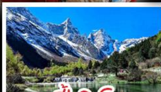
ปี้เฉิงโกว