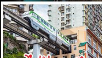
รถไฟทะเลตุ๊ก