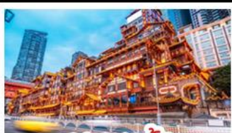
เฉิงเฉิงเฉิง

อุทยานหลุมบ่อฟ้า - อุทยานเจนางฟ้า หงหยาดัง - นังรถไฟทะเลตุ๊ก - อุทยานสีดรุณี ปี้เฉิงโกว - สะพานหนานเฉียว