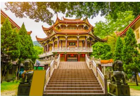
วัดหนานถ้าวชื่อ

ค่ำ รับประทานอาหารค่ำ ณ ภัตตาคาร (1) พักที่ โรงแรม XIAMEN HENGLONG HOTEL 4* หรือเทียบเท่าในเมืองเซี่ยเหมิน