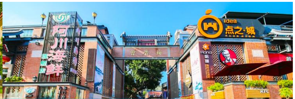
หมู่บ้านชาวประมง เจิงจ้าวอัน