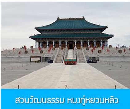
สวนวัฒนธรรมหมงกู่หยวนหลิว

พักที่ ORDOS BOYU AIRUI HOTEL โรงแรมระดับ 4 ดาวท้องถิ่น หรือเทียบเท่าในเมืองเออร์ดอส