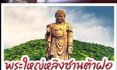
พระใหญ่หลังซานต้าฟอ