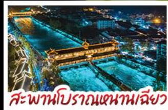
สะพานโบราณเขานางฟ้า