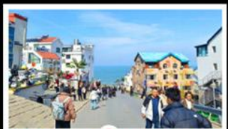
ถนนคอปเพิลิงหมายเลข 8

สัมผัสความยิ่งใหญ่ของ 4 เมืองสำคัญ ชิงเต่า - เยียนโก - เฟิงไห่ - เว่ยไห่ ปาต้ากวน - โบสถ์คาทอลิก - ตึกเก่าริมหา