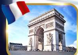
ประตูชัยอาร์กเดอทริยัมฟ์