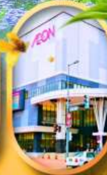
อ็อนมอลล์