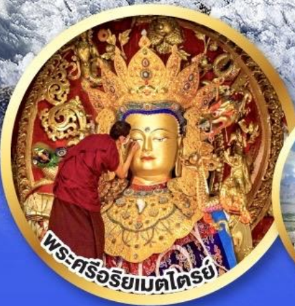
พระศรีอริยเมตไตรย์