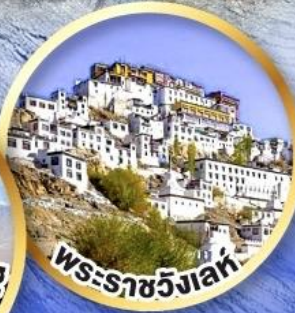
พระราชวังเลห์