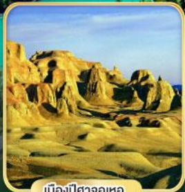
เมืองปีศาจอุเทอ