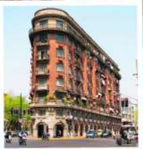
ถนนอุคิง