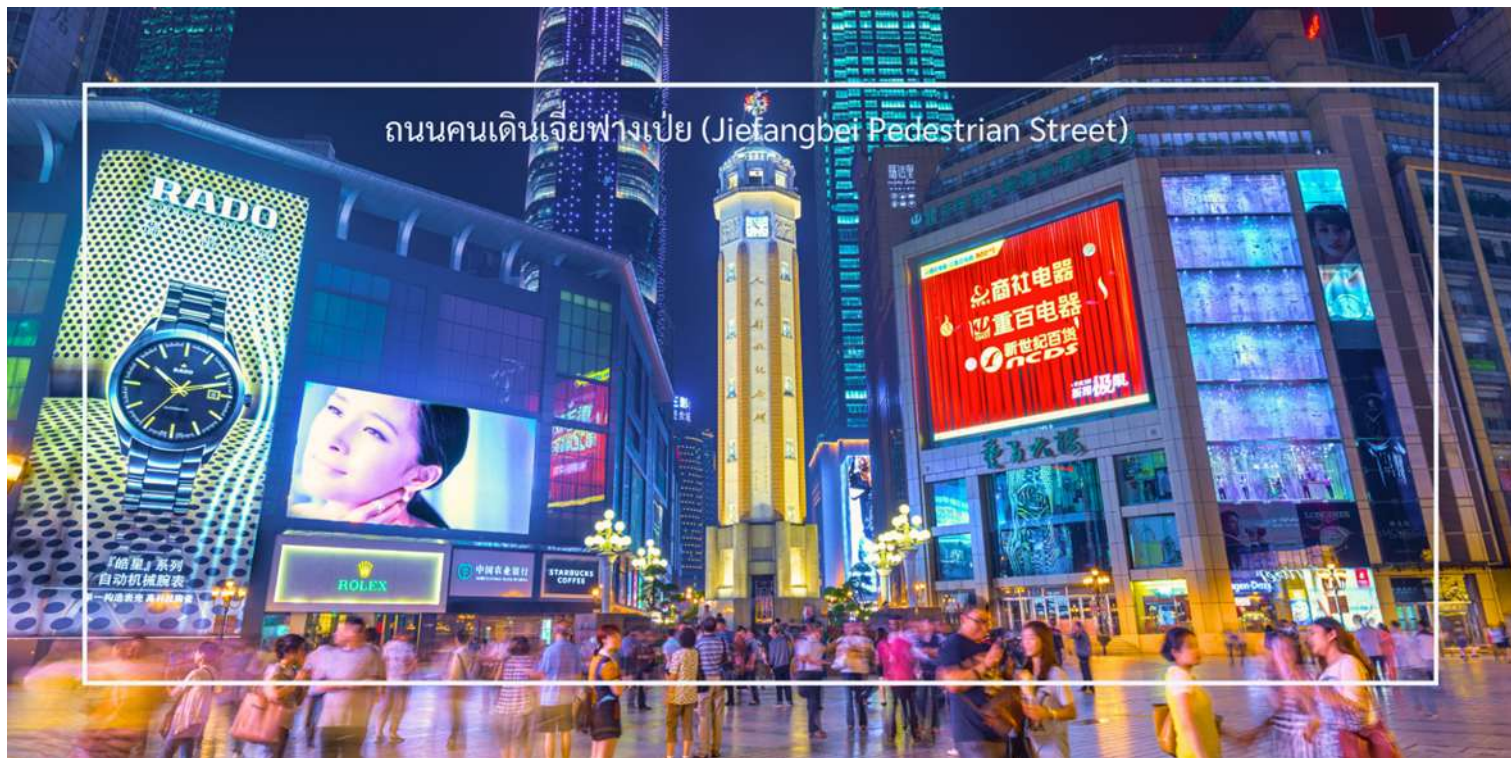
ถนนคนเดินเจี๋ยฟางเป่ย์ (Jiefangbei Pedestrian Street)

สมควรแก่เวลานำท่าน อีสระซ้อปั้ง ถนนคนเดินเจี๋ยฟางเป่ย์ (Jiefangbei Pedestrian Street) ที่แห่งนี้เป็นหนึ่งในแหล่งช้อปปิ้งและท่องเที่ยวที่สำคัญที่สุดในเมืองฉงชิ่ง (Chongqing) เป็นพื้นที่ที่มีชีวิตชีวาและคึกคัก มีร้านค้า ร้านอาหาร และสถานบันเทิงมากมาย ถนนสายนี้มีบรรยากาศที่มีชีวิตชีวา โดยเฉพาะในช่วงเย็นที่มีแสงไฟและการแสดงต่างๆ ที่ทำให้บรรยากาศน่าสนใจยิ่งขึ้น และยังเต็มไปด้วยร้านค้าแบรนด์เนม ร้านค้าท้องถิ่น และตลาดที่ขายสินค้าต่างๆ เช่น เสื้อผ้า เครื่องประดับ และของที่ระลึก แวะชมร้าน POP MART ร้านดังจากจีน ที่รวมฟิกเกอร์ดีไซน์เก๋และตุ๊กตาน่ารักหลากหลายซีรีส์ยอดนิยม เช่น Molly, Dimoo, Labubu และอีกมากมาย