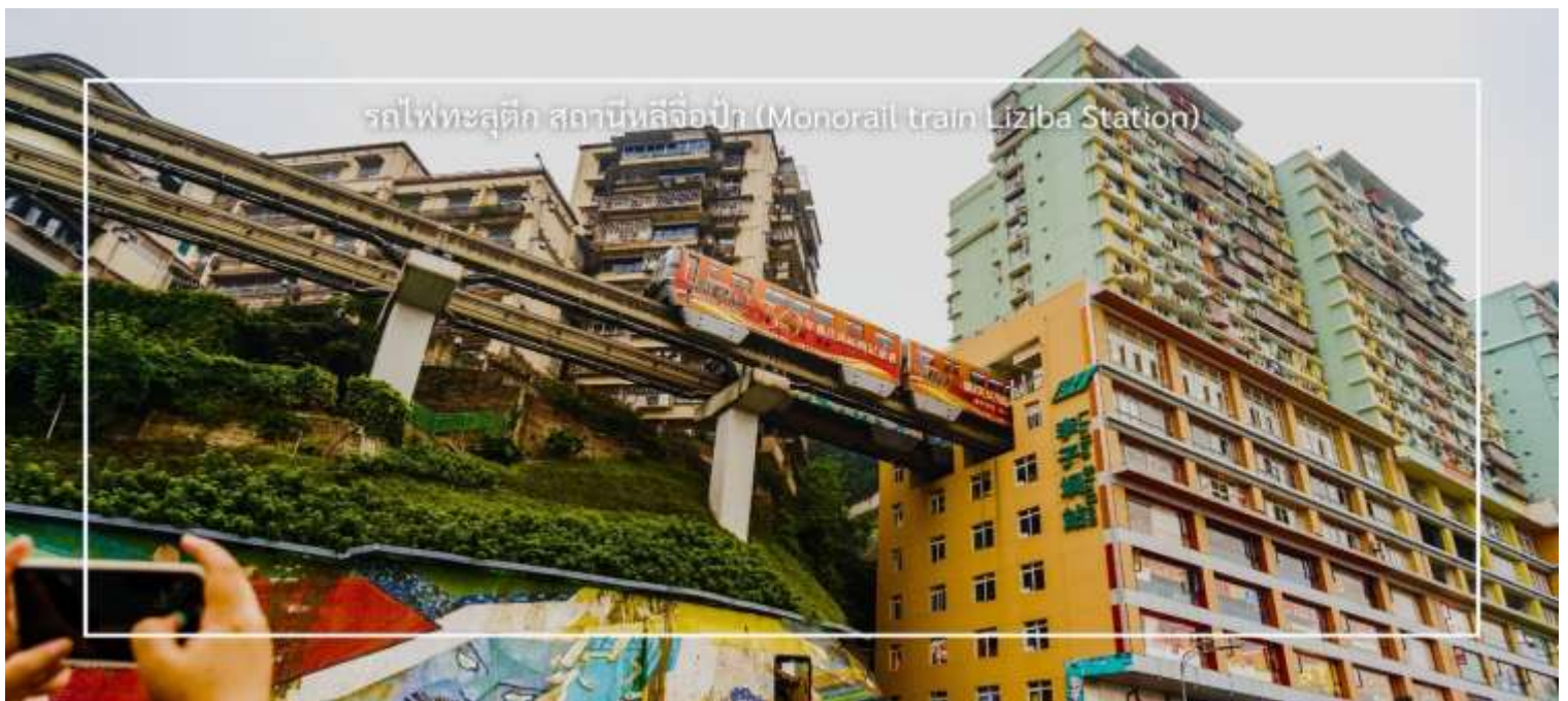
รถไฟทะลุตึก สถานีหลี่จื่อป้า (Monorail train Liziba Station)

นำท่านชม รถไฟทะลุตึก (Monorail Train) หนึ่งในแลนด์มาร์กที่สะท้อนความทันสมัยและเอกลักษณ์ของเมืองฉงชิ่ง รถไฟฟ้าโมโนเรลสาย 2 วิ่งทะลุผ่านตัวอาคารสูงอย่างน่าทึ่ง ซึ่งเป็นวิศวกรรมการสร้างสุดแปลกตา กลายเป็นปรากฏการณ์ที่โด่งดังระดับโลก ท่านสามารถชมและถ่ายภาพโมเมนต์สุดล้ำนี้จากมุมต่างๆ ของเมือง จุดชมวิวนี้นอกจากสร้างความตื่นตาตื่นใจ แต่ยังเป็นสัญลักษณ์ของการผสมผสานระหว่างเมืองสมัยใหม่กับภูมิประเทศที่มีภูเขาและแม่น้ำรายล้อม