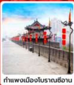
กำแพงเมืองโบราณซีอาน