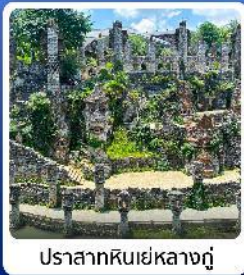
ปราสาทหินเย่หลางกู๋