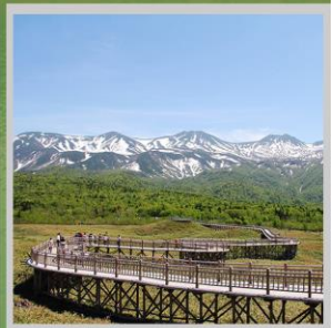
"SHIRETOKO 5 LAKES"