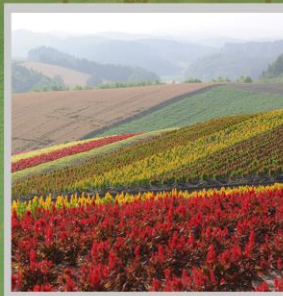
"SHIKISAI NO OKA"