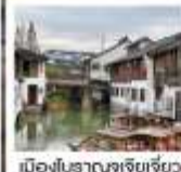
เมืองโบราณซูเจียเจียว