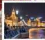
เมืองซีอานคังในท์