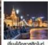
เชียงใหม่กลางคืนโตนา