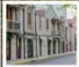
แลนด์มาร์กจางหยวน