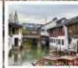
เมืองโบราณซูเจียเจียว